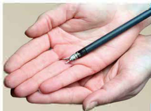
体内に挿入する 鉗子

近年では腹腔鏡下手術や内視鏡下手術の技術や器材の進歩により、低侵襲で安全な外科的処置が普及してきました。ロボット支援下手術では、内視鏡下手術と同様に、腹部に8mm～12mmの穴を5箇所開け、そこから鉗子という器具を挿入し、内臓の切除などを行います。3Dモニターによって立体的に術野を見ながら、手ぶれがない状態で、自由自在な操作が可能(関節機能)であり、ミリ単位の血管もより正確に取り扱うことが可能です。